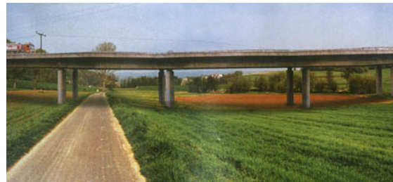
B38a-Variante O2: Umweltfeindlich und teuer

Es können zusätzliche Kosten auf den BUND zukommen, falls das Gericht festlegt, dass der BUND die Gutachten der Klagegegner zu zahlen hat. Dafür hat der BUND mehrere Tausend Euro eingeplant. Um die Klage des BUND finanzieren zu können, sind Spenden herzlich willkommen (Kontoverbindung unter www.tunnelloesung.de ).