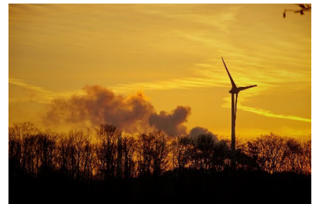
Windkraft kann auch ästhetisch sein

Im Kreis Bergstraße existieren heute 15 Windräder in drei Windparks , am Greiner Eck im Neckartal, der Stillfüssel bei Wald-Michelbach und zuletzt der Windpark Kahlberg bei Fürth. Das ist ein Anfangserfolg. Bei der Einweihung der Fürther Anlagen hat der BUND 2018 ein Grußwort gesprochen, was uns auch Applaus einbrachte. Anschließend haben wir mehrere Stunden mit protestierenden Windkraftgegnern gestritten. Nicht jeder hat uns zugehört, aber manche wurden nachdenklich: Für die drei Windparks fielen weniger als 10 Hektar Bäume, aber im Rheintal verdursteten Tausende Hektar Wald durch monatelange Trockenheit.