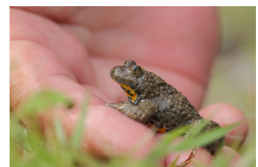
Findet Schutz im Steinbruch: Gelbbauchunke